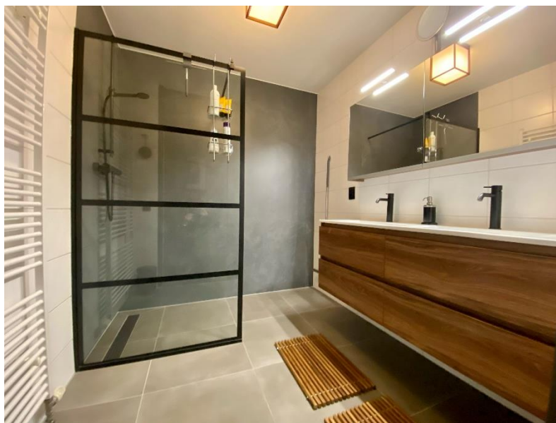
Inloopdouche met badkamermeubel met vier laden en twee wasbakken en twee kranen. Daarboven een spiegelkast met binnenin twee contactdozen.

Na 17 jaar vonden wij het tijd worden om onze badkamer te laten verbouwen. Het zit in mijn aard om een dergelijke verbouwing procesmatig aan te pakken. Veel research ging daarom aan de verbouwing vooraf. Dat betekent het verzamelen van info, reviews bekijken van badkamerzaken, veel lezen en uiteraard nadenken over wat we precies wilden. Onze oude badkamer had een douchecabine en twee losse wastafels. We waren er al snel over uit dat we een inloopdouche wilde en geen douchecabine meer. Daarnaast wilde we een badkamermeubel met twee wasbakken en kranen. Met het uiteindelijke resultaat zijn we erg tevreden. Met dit artikel deel ik wat tips, waarvan ik hoop je er je voordeel mee kan doen als je in de nabije toekomst je badkamer laat verbouwen. Allereerst een foto van onze badkamer na de verbouwing.